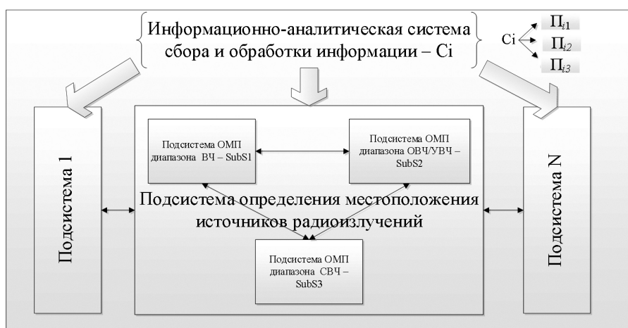
Рис. 2. Структурная модель иерархического представления системы сбора и информационно-аналитической обработки информации

Оценивание показателей эффективности системы определения местоположения [6] по какой-либо шкале приводит к необходимости деления показателей по типу на количественные и качественные. К количественным, например для системы определения местоположения, можно отнести такие показатели, как точность определения координат, среднеквадратическая ошибка пеленгования, пропускная способность и т.д. Однако оценить устойчивость, оперативность,